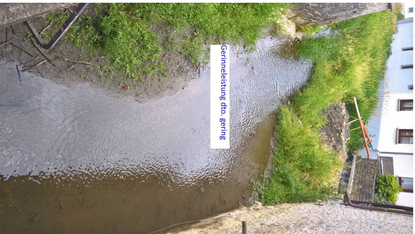
Gerinnleistung dto. gering