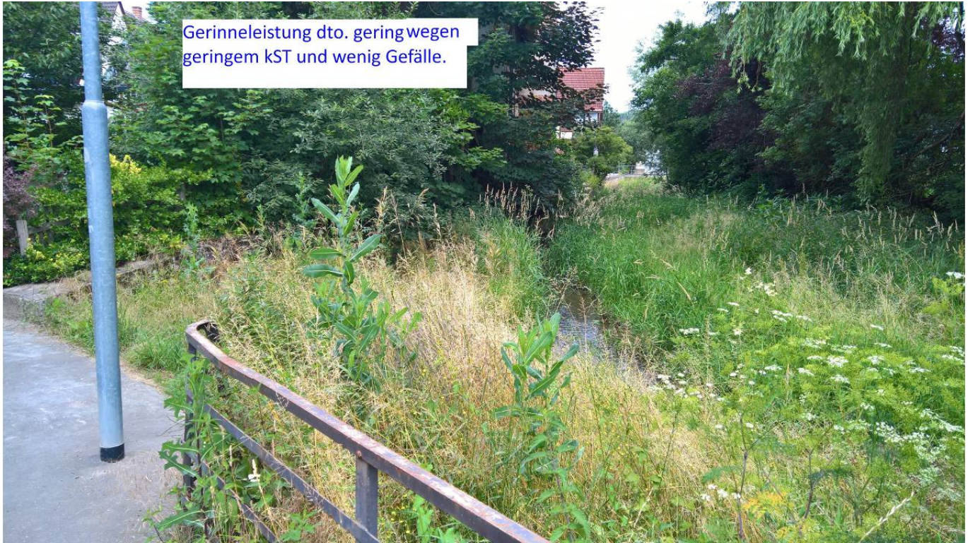
Gerinneleistung dto. gering wegen geringem KST und wenig Gefälle.