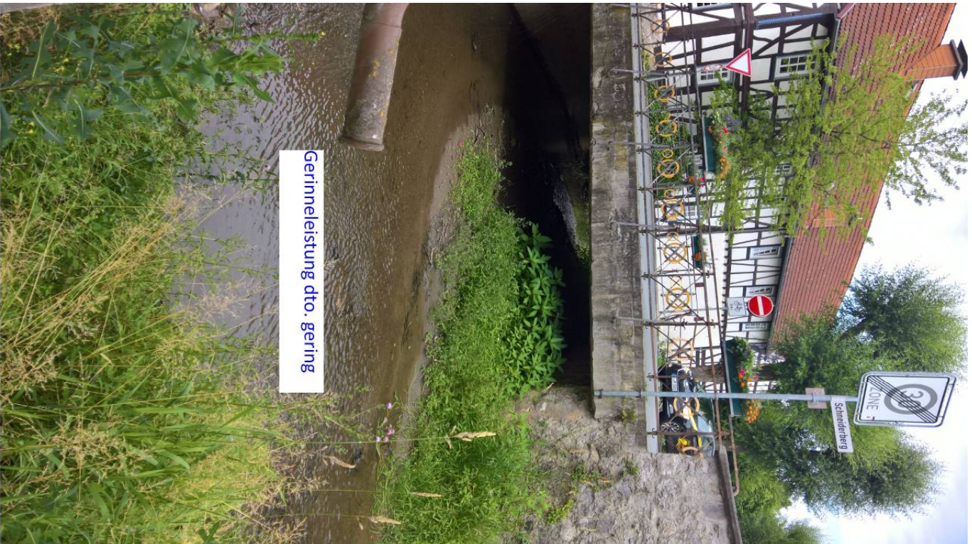
Gerinnleistung dto. gering